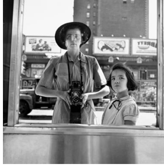
Fotoğraf 1. Finding Vivian Maier: İlham Veren Bir Yaşam Hikayesi Filminden Bir Sahne 13