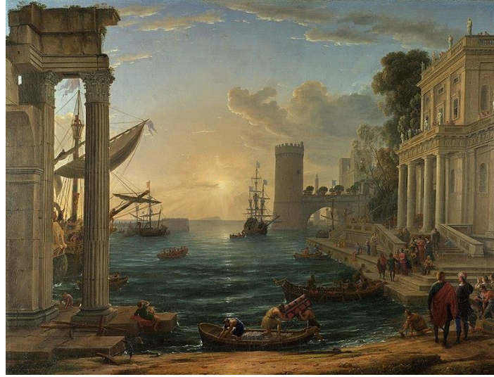
Resim 5. Klasisizm Ressam, Claude Lorrain, "Sheba Kraliçesinin Binişi"

17. Yüzyılın Klasisizm sanat akımını gerçeklik olgusuyla öncü isimlerden olan Claude Lorrain, eserlerinde yer alan detaylar bağlamında, kuşkusuz günümüz Fotogerçekçi akımının niteliklerini taşıdığını söylemek mümkündür. Kuralcılık olarak nitelendirilen sanatçıların eserlerinde; en yetkin ve en uyumlu üslubuyla resmetmek onların en temel amaçlarıdır (Sanal 1, 12 Kasım 2016).