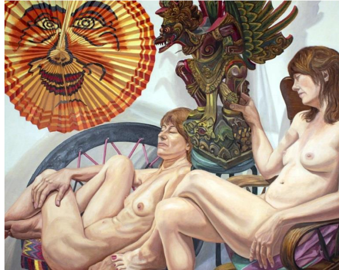
Resim 3. Philip Pearlstein, "Fener ve Garuda Figürlü Modeller", T.Ü.Y.B., 187.9x157 cm., 2015.

rastlantısal olarak üretmemişlerdir (Çakmakçı, 2007. s.121). Sanatçılar eserlerini üretirken kullandıkları tekniklerde ilk olarak fotoğraf makinesinden yararlandıkları bilinmektedir. Oluşturdukları kompozisyonları çeşitli araçlar doğrultusunda tuvallerine aktarmışlardır: Bahsi geçen teknikler incelendiğinde, sanatçıların bir kesimi projeksiyon cihazı, airbrush aleti veya geleneksel yöntem olan kareleme tekniği ile fotoğraf ve tuval arasındaki benzersizliği en aza indirmeye çalışmışlardır (Aydın, 2009. s.125). Ancak konu olarak ele aldıkları fotoğraflar için sadece bu teknikleri uyguladıklarını söylemek mümkün değildir; çünkü fotoğrafı çekilen nesneyi olduğu gibi aktaran, düzenlemeden kaçan sanatçıların da olduğu gibi, tek bir fotoğrafı farklı bir şekilde stilize edip çalışmalar üreten sanatçıların da olduğunu söylemek mümkündür. Bu doğrultuda fotoğraf nesnesinden referans aldıkları materyalleri bilinçli bir şekilde çalışmalarına aktardıkları söylenebilir. Fotogerçekçi sanatçıların genelinin halen yaşıyor olması (Gökdoğan, 2011. s.244), akımın güncelliğini günümüze kadar koruduğunu söylemek mümkündür.