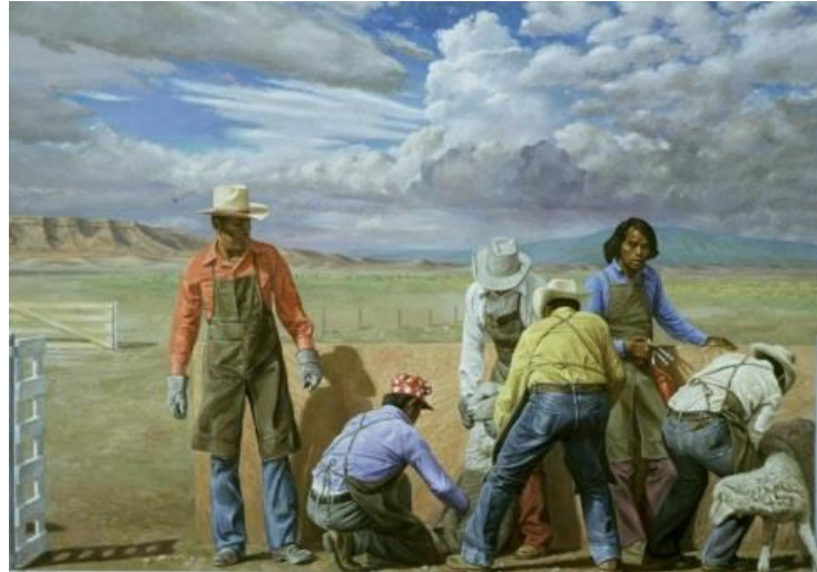
Resim 6. Fotogerçekçi Ressam, Willard Midgette, "Koyun İşleme"

17. Yüzyılın Klasisizm sanat akımını gerçeklik olgusuyla öncü isimlerden olan Claude Lorrain, eserlerinde yer alan detaylar bağlamında, kuşkusuz günümüz Fotogerçekçi akımının niteliklerini taşıdığını söylemek mümkündür. Kuralcılık olarak nitelendirilen sanatçıların eserlerinde; en yetkin ve en uyumlu üslubuyla resmetmek onların en temel amaçlarıdır (Sanal 1, 12 Kasım 2016).