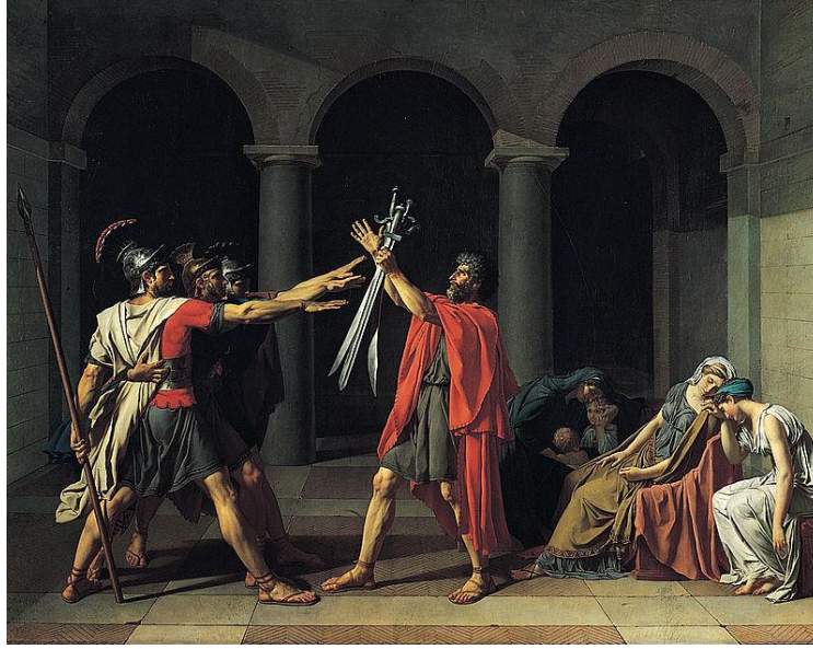
Resim 1. Jacques-Louis David, 'Horas Kardeşlerin Yemini', T.Ü.Y.B., 330x425 cm., 1784.