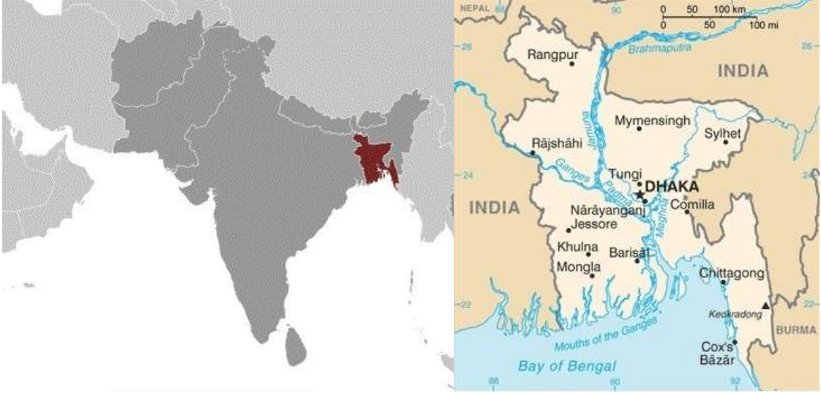
Resim 1: Dünya haritasında Bangladeş