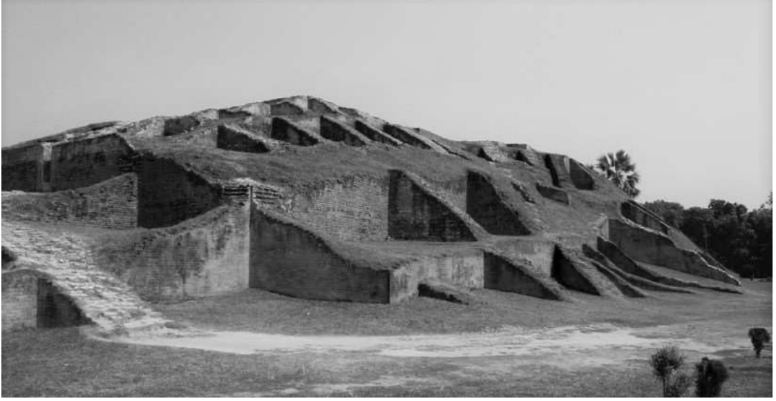
Mahasthangarh, Pundranagar'ın kalıntılarından biri.

Mauryaların hâkimiyetinin ne kadar sürdüğü kesin olarak bilinmemektedir. Kaynaklarda M.S. IV. yüzyılın başlarında Bölgede birkaç bağımsız devletin bulunduğu dair bilgiler, Maurya hâkimiyetinin düşüşünden sonra Bölgede siyasal istikrarsızlığa işaret etmektedir. O dönemde Doğu Bengal'de Samatata İmparatorluğu ve Batı Bengal'de Pushkarana İmparatorluğu'nun kurulduğu bilinmektedir. Pushkarana imparatorlarından biri olan Çandravarma'nın çok güçlü bir imparator olduğu ve onun döneminde topraklarının Faridpur'a kadar genişlediği bilinmektedir. 13