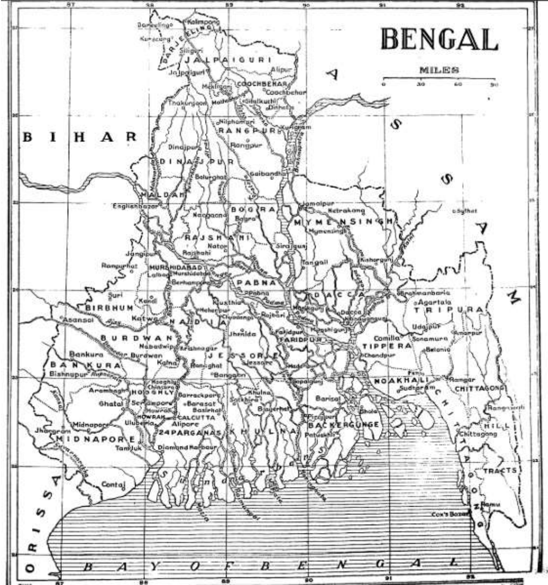
Figür 3: Bengal Haritası