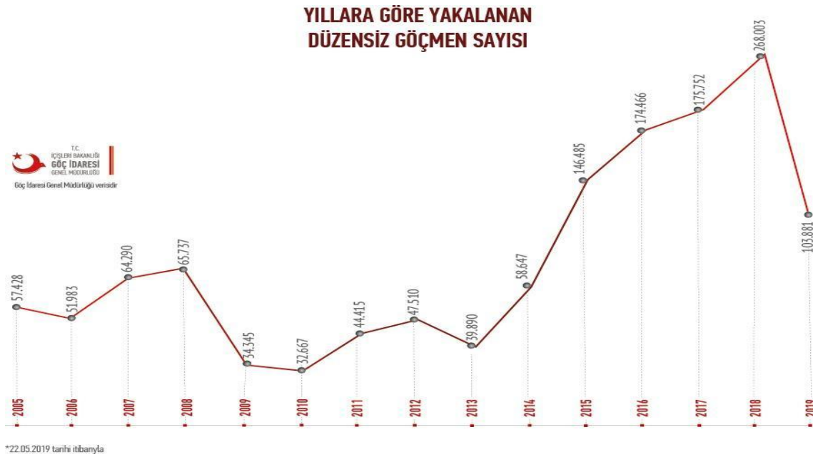
Tablo 1. Yıllara Göre Yakalanan Düzensiz Göçmen Sayısı 14

Suriye'deki iç savaştan kaçan göçmenler 2014 ve 2015 yıllarında daha çok alternatif yolları kullanmaya başlamışlardır. Ege Adaları ve Türkiye-Bulgaristan karayolu AB ülkelerine giden göçmenlerin artarak kullandığı transit noktalar haline gelmiştir. Bu durum öncelikle Yunan adalarının mültecileri ağırlama kapasitelerini zorlamaya başlamıştır. Tablo-1'de görüldüğü üzere, Suriye krizinden sonra, 2005 ile 2011 yılları arasında nispeten yatay seyreden düzensiz göçmen sayısı 2011 Suriye krizi sonrasında, 2013 yılı hariç diğer devam eden yıllarda düzensiz göçmenlerin sürekli arttığını görülmektedir. Bu çerçevede iç savaştan, baskıcı yönetimden veya çeşitli terör örgütlerinin şiddetinden kaçan milyonlarca Suriyeli, geçici koruma statüsüne tabi oldukları Türkiye'den kitleler halinde, Avrupa ülkelerine çeşitli yollardan girerek sığınma talebinde bulunmaya başlamıştır. AB ise yükselen bu göç dalgasını temelde bir güvenlik meselesi olarak algılamıştır. 15 AB'nin güvenlik ve sosyal sorunlarla yüzleşme kaygısı nedeniyle Türkiye-AB ilişkilerinde vize serbestliği, AB üyeliğinde fasılların açılması ve nakdi yardım karşılığında iş birliği, gündeme gelmiştir. 16 Bu bağlamda Mülteci krizin bir Avrupa krizine dönüşmeye başladığı dönemlerde krizin çözümüne yönelik önemli adımların atıldığı 2015-2016 yılları arasında Türkiye ile AB arasında "stratejik ortaklık" söylemleri de yankı